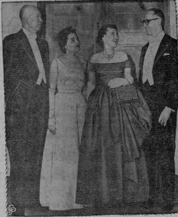
El Presidente de Argentina Arturo Frondizi y su esposa fueron agasajados por el Presidente Eisenhower y su esposa con una comida oficial en la Casa Blanca. Se les ve posando para los fotógrafos en el Salón Oval. El Presidente argentino y su esposa están en Washington en una visita oficial.

Causó gran impresión a Eisenhower.— Ahora iniciará fase "comercial" de su viaje.—